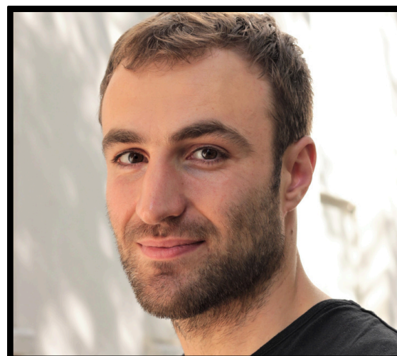
texte & mise en scène Louis Ferrand *