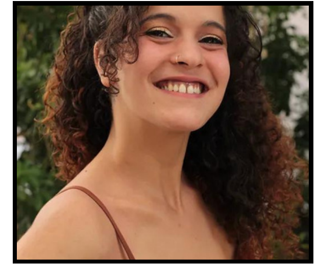
Seconde Nima *